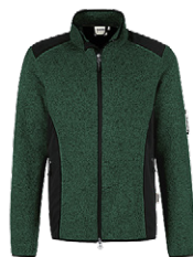
372 tanne meliert