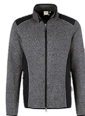
328 anthrazit meliert