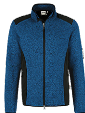
310 royalblau meliert