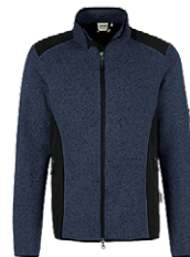
329 marine meliert