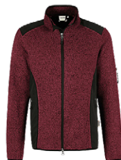
317 weinrot meliert